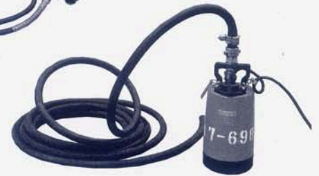
100V スイペットポンプ