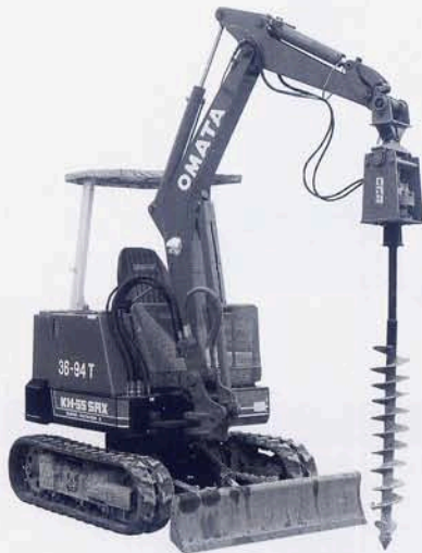
KH55SRXG アースオーガー付