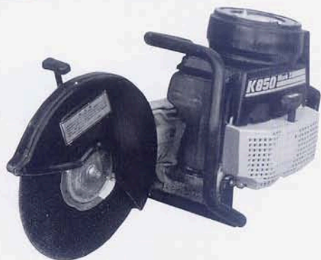
パートナーカッター