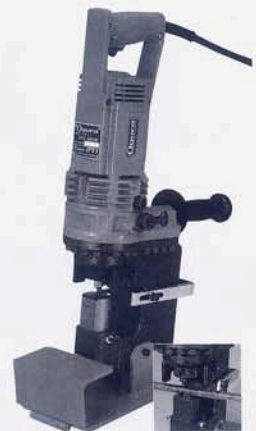
Cチャンパンチャー HPC-620N