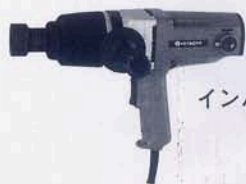
インパクトレンチ WH-22