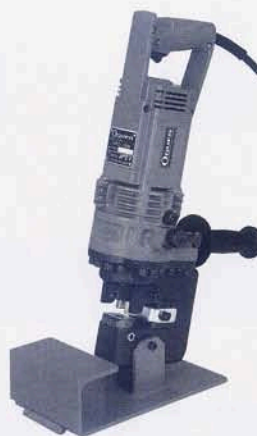
ハンドパンチャー HPC-18N