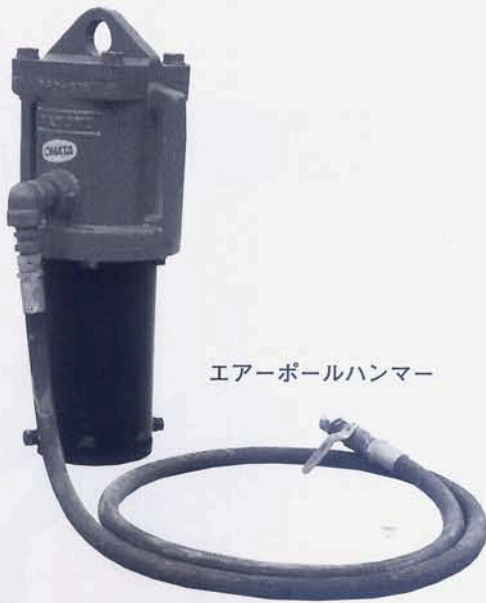
エアールハンマー