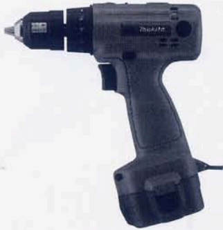
充電式ドライバー