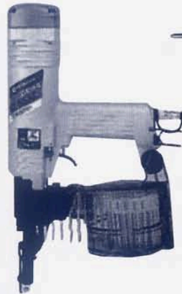
コンクリート釘打ち