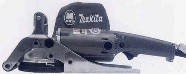
コンクリートカンナ