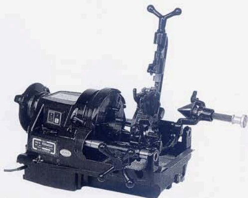
N80A III GX