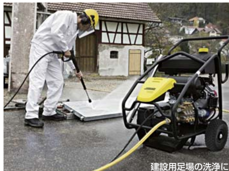
建設用足場の洗浄に