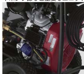
信頼のホンダ製エンジン

エンジンは信頼性の高いホンダ製です。エンジン速度調整機能を装備しており、トラブルを防止します。また、本体を囲む頑丈なフレームは、エンジンやポンプ部など主要なユニットを守ります。