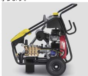
本体ユニットを守る頑丈なフレーム