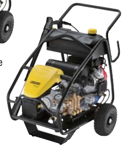
HD 9/50 Pe Cage