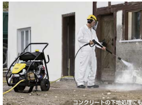
コンクリートの下地処理にも