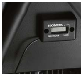
エンジン速度調整機能

1) 作業をしていない時に、エンジンの回転を抑えてエンジンへの負荷を軽減します。