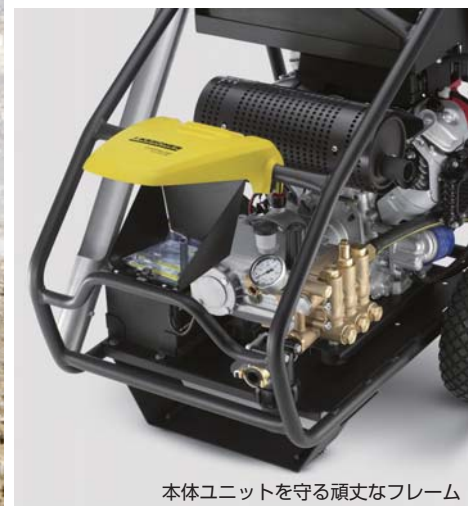
本体ユニットを守る頑丈なフレーム