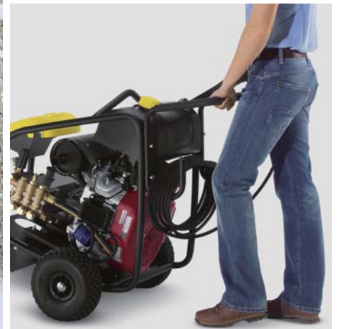
移動に便利な大型タイヤ