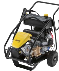
HD 13/35 Pe Cage