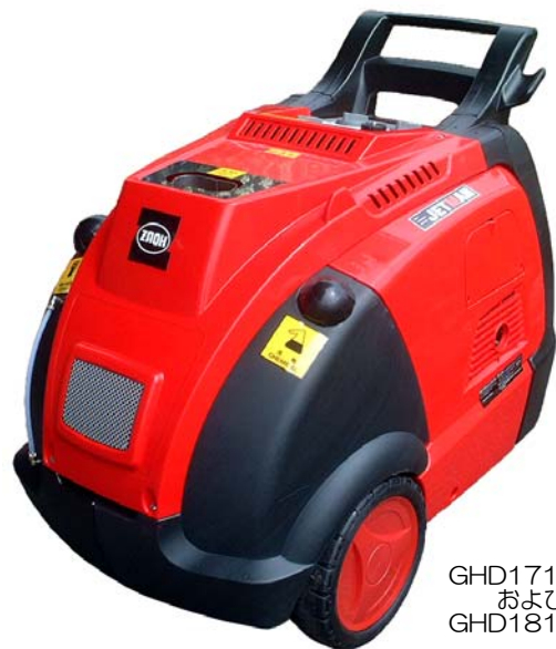
GHD1714-II および GHD1813-II