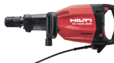
ヒルティ 中ハンマー TE1000-AVR