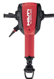
100V 強力ブレーカー TE3000-AVR