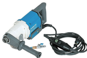
ハンドコアドリル RH1531