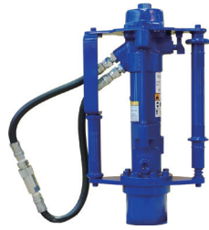
油圧杭打機 (単管パイプ専用)