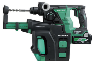
36V 集塵ロータリーハンマードリル