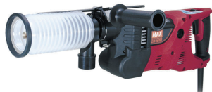
乾式静音ドリル MAX DS181D