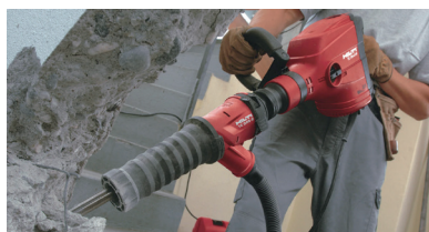
ヒルティ ハツリ用集塵システム