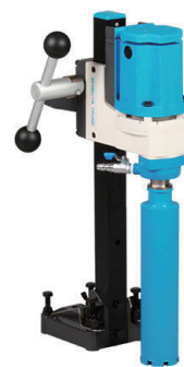
100V コアドリル TS-092