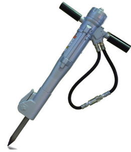
油圧ハンドブレーカー大 BR-23RK