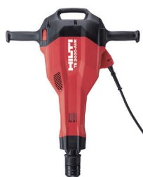
100V ブレーカー TE2000-AVR