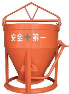
コンクリートバケツ 0.4m 3