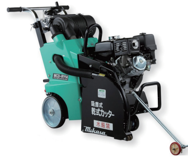
吸塵式乾式(E)コンクリカッター