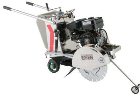
14" (E) コンクリートカッター