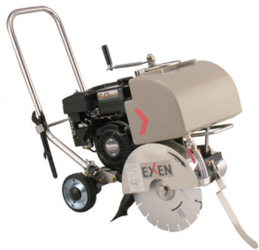
12" (E) コンクリートカッター