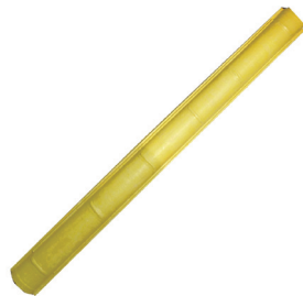
コンクリートシュート 2m/3m/4m