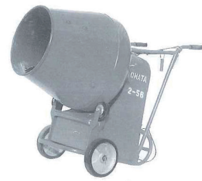
100V ローラー(コンクリ)ミキサー