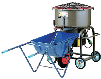
100V モルタルミキサー 75L