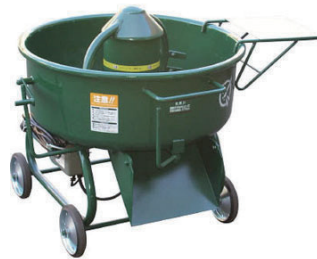
100V モルタルミキサー 95L