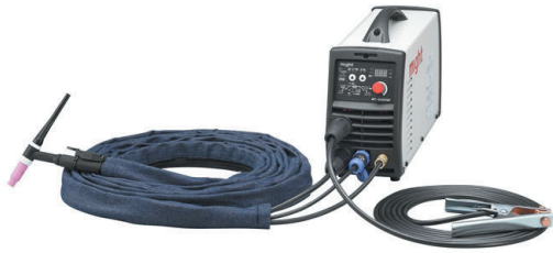
100V/200V 兼用 TIG 溶接機 200Amp MT-200FDP