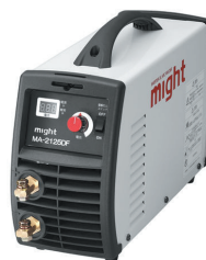
200V インバーター溶接機 MA2125DF (最軽量)