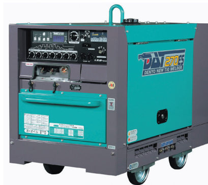
エンジン TIG 溶接機 270Amp DAT-270ES