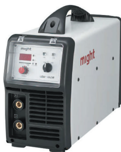
100V バッテリー溶接機 LBW-152W (軽量)