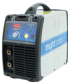
100V バッテリー溶接機 LBW-160G (最軽量)