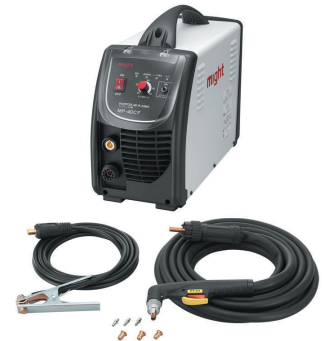
単相 200V エアープラズマ切断機 40Amp MP-40CF