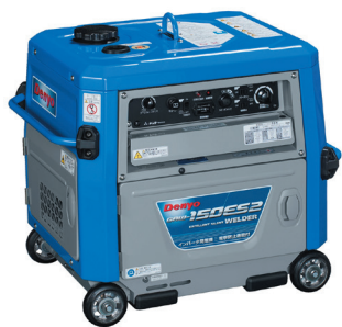
エンジン 150A GAW-150ES2