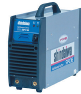
100V エアープラズマ切断機 16Amp SPC-16C