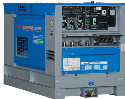
エンジン300A (180A×2人) DLW-200x2LSE