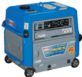
エンジン 190A GAW-190ES