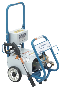
100V 高圧洗浄機 (40kg 圧)