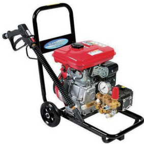
エンジン高圧洗浄機 (100kg 圧)