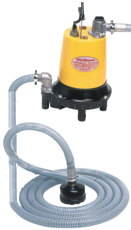
100V Q-HI ポンプ