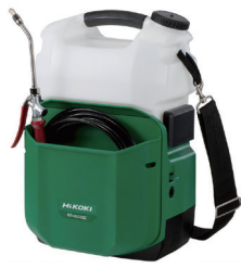
コードレスエアコン用 高圧洗浄機