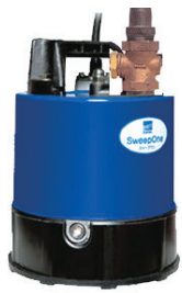
100V スイペットポンプ (φ 25)