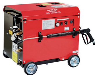
200V 温水高圧洗浄機 (85kg 圧)