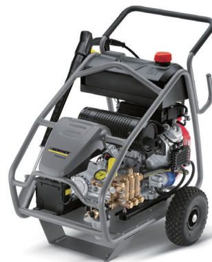
エンジン超高圧洗浄機 (500kg 圧)