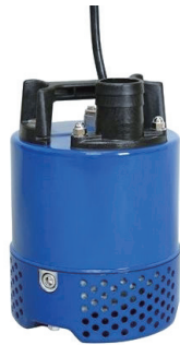
100V 2インチ水中ポンプ