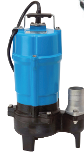
100V 2インチ水中ポンプ (異物 OK)