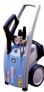
100V 高圧洗浄機 (100kg 圧)