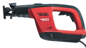
100V セーバーソー各種 HILTI WSR900PE