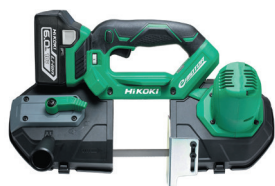
18V コードレスバンドソー CB18DBL