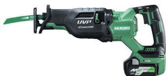
36V コードレスセーバーソー CR36DA