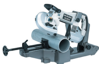
バンドソー φ120/φ180 (定置スタンド付もあり)