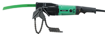
100V パワースー (パイプソー) バイス付