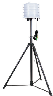
150W サークルライト (キャスター三脚付)