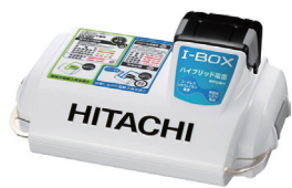
ポータブル電源 30Wh (14.4V リチウム電池)