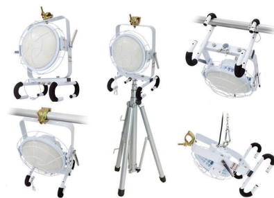
LED マルチウェイライト (水銀灯 700W 以上の明るさ)