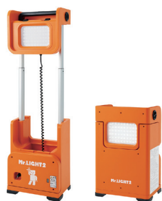
正面 裏面 LED 灯 ミスターライト