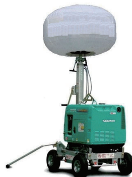
1kW (E 付) バルーンライト