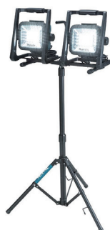
18V/100V 兼用 LED ライト (写真は 2 台用スタンド仕様)