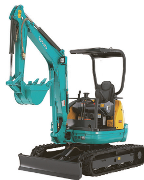
2t 後方小旋回 (配管) U-20-3S (幅 1400)