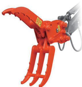
首振りフォークグラブ 1.5t & 2t 兼用 /3t 用