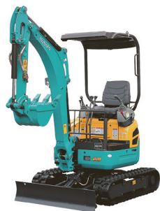
1.5t 後方小旋回 (配管) U-15-3S (幅 990/1240)