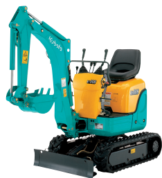
0.8t 後方小旋回 (配管) U-008DH (幅 700/840)