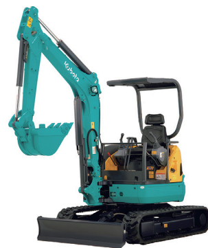
3t 後方小旋回 (配管) U-30-5 (幅 1550)