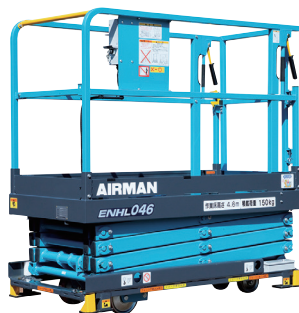
らくノリ君 4.6m ★移動のみ手動 資格不要