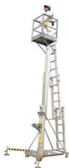
ハシゴリフト 4.6 m ★資格不要