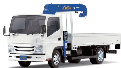
3.25t ユニック 4 段ブーム