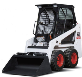
ボブキャット S70 幅狭仕様 ★狭所での運転・旋回も可能