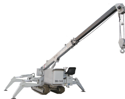
2.9t カニクレーン TC304