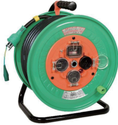
100V コードリール 3.5sq × 30m 防塵型漏電 CB 付