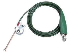
(販) メタセンアダプター各種 * 写真は深さゲージ取付用