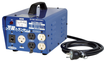
昇圧トランス 100V → 115V/125V 3kVA 日動工業 FTBO300