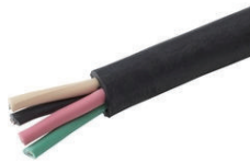
キャブタイヤコード各種 3.5sq ~ 22sq