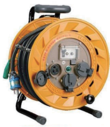
100V コードリール 3.5sq × 30m 漏電 / 過電流 CB 付