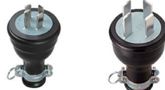
20A 丸型 30A 丸型