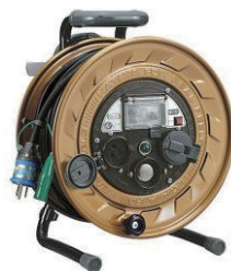
100V コードリール 3.5sq × 30m メタルセンサー・漏電 CB 付