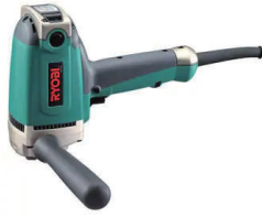
100V ビルメン用ハンドポリッシャー (低速型) PE1400