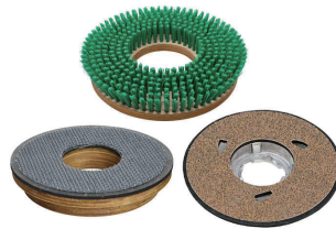
ナイロンブラシ 及びパット台 各種