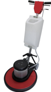
17" フロアポリッシャー (低速/高速切替・タンク付)