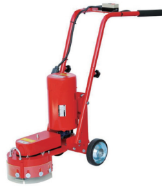
100V 床研磨機 研た (集塵機別)