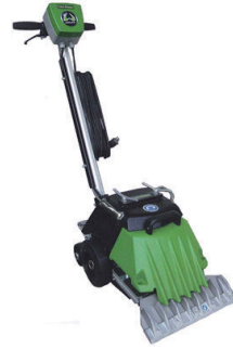
100V ターボストリッパー (自走式強力剥がし機)