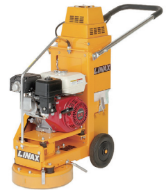
エンジン床研磨機 K-30N (100V 集塵機付)