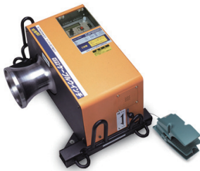
100V ケーブルウィンチ CW-2500D