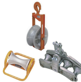
アルミ金車・ケーブルコロ