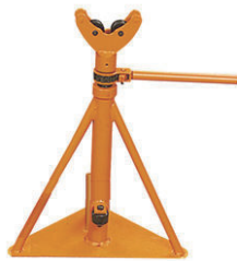
ケーブルジャッキ ISJ-0680