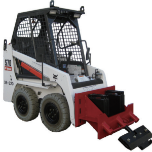
剥がしアタッチメント付 スキッドステア Bobcat S70