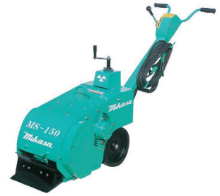
100V 自走式 フロアスクレーパー MS-150