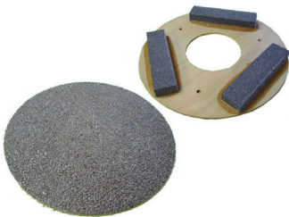
(販) 12" マシニングペーパー各種 & ポリッシャー用砥石