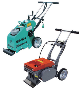
100V ペッカー 及び Mikasa MS-60