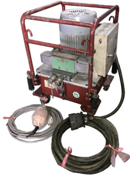
三相 200V 3.7kW 油圧ユニット