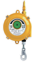
スプリングバランサー各種 (クラッシャーの吊具として)