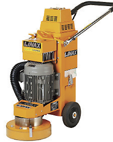
三相 200V 床研磨機 K-30ENV (インバーター)