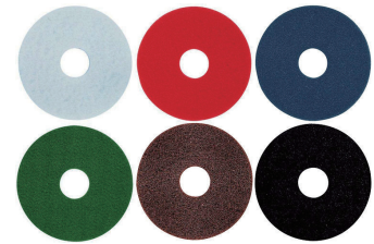
(販) フロアパット各種 13"/15"/18"