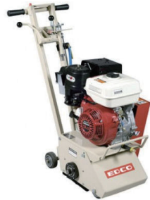
エンジン研削機 (床ハツリ機) CPM-8