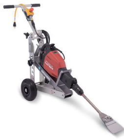
100V 剥がし用トローリー (HILTI TE1000/1500 用)