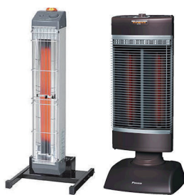
床置遠赤外線ヒーター各種