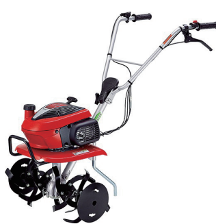
エンジン耕運機 Honda F220JT