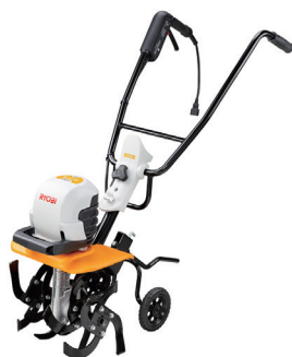
100V 耕運機 Ryobi ACV-1500