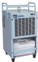
100V 除湿機 DW02