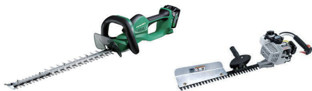
36V ヘッジトリマー HiKOKI CH3656DA