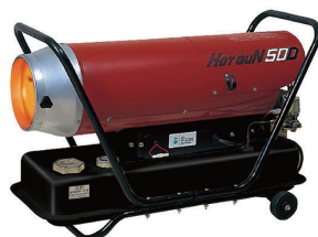
熱風式ヒーター ホットガン HG50D