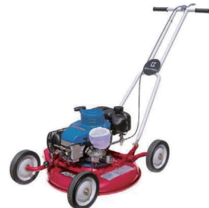
エンジン芝刈機 パロネス GM50E