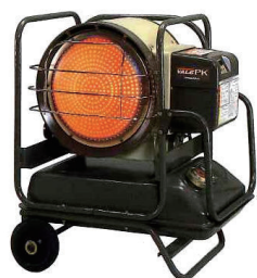
赤外線ヒーター (業務用) VAL6PKO