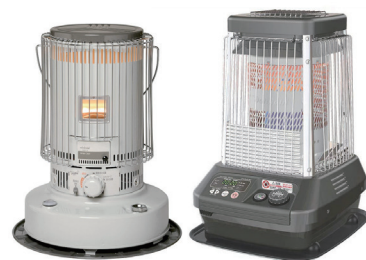
丸型ストーブ 及び ブルーヒーター