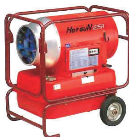
熱風式ヒーター ホットガン HG125R