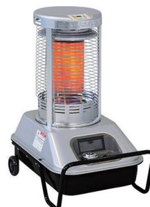
赤外線 + 温風 サンストーブ SSN5