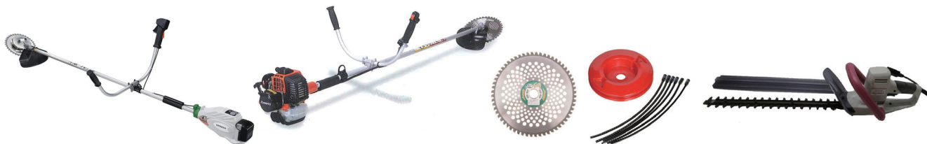
18V コードレス刈払機 Hitachi CC14DSL