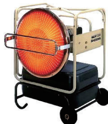
赤外線ヒーター (業務用) VAL6KBS