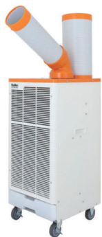
100V スポットエアコン