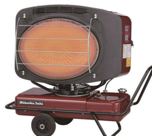
赤外線ヒーター (業務用) VAL6SY