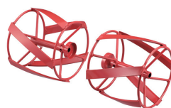
(オプション) 除草/骨材攪拌用 スパイラルローター