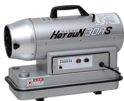
熱風式ヒーター ホットガン HG30RS