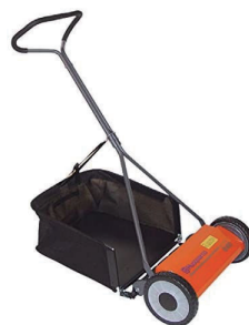
手押し式芝刈機 ハスクバーナ 540N