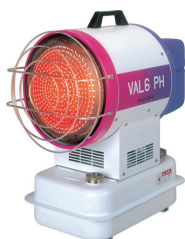
赤外線ヒーター (業務用) VAL6PH