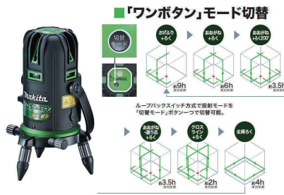
レーザー墨出器<グリーン> Makita SK504GPZ