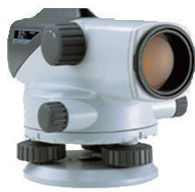
オートレベル B21 (三脚付)