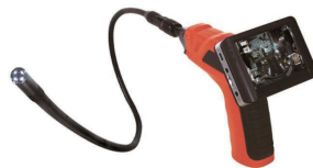
ファイバースコープ (簡易型)