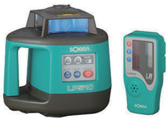
レベルプレーナー LP510 (三脚・受光器付)